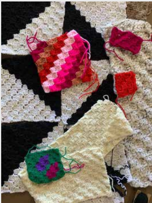
Hoek-tot-hoek-hekelwerk (C2C, corner to corner)