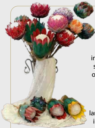
Handgemaakte proteas deur Klein-Brakrivier .