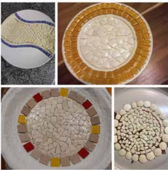
in Mosaïek bak of bord met volstruis-eierdoppe.

Laastens, het jy die boek geniet, motiveer jou antwoord. Sal jy ander aanmoedig om hierdie boek en ander boeke van hierdie skrywer te lees, motiveer jou antwoord. En sluit af deur enige pryse wat hierdie boek en/of die skrywer gewen het.