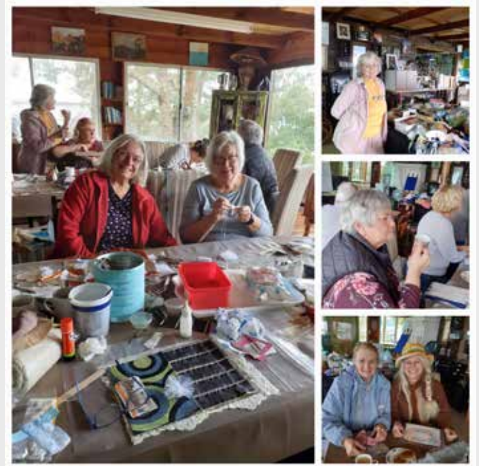
Die lede geniet die ervaring om h'n herinneringsboek met die Shabby-chic -metode te maak.