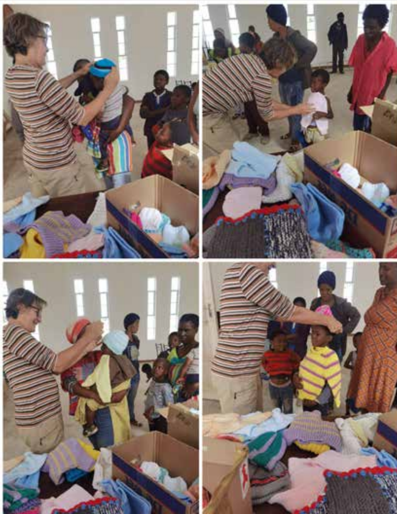
The little ones in Sterkstroom were given jerseys and beanies by the CWAA ladies at the Blessing Pot Feeding Scheme. A number of the CWAA ladies work there every week and donate foodstuff for the pot.