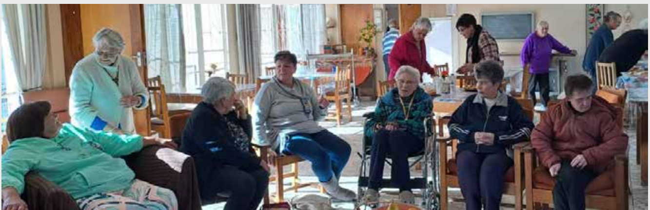
Die inwoners van Nerinahof word deur Dordrecht bederf.