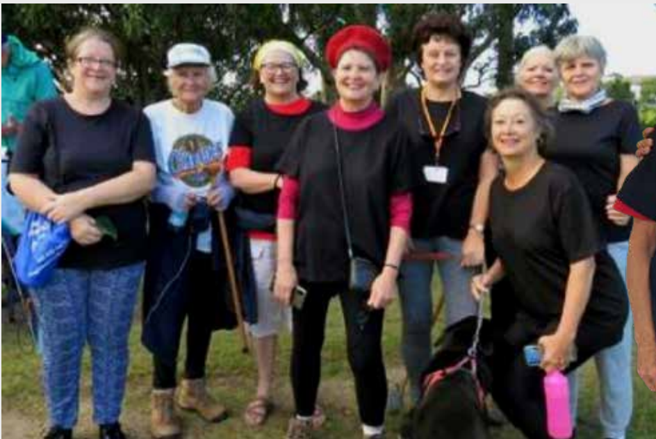
Bredasdorp stap Women Walk the World .